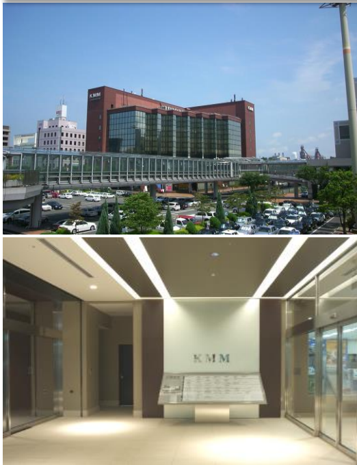
(外観及び内観写真)